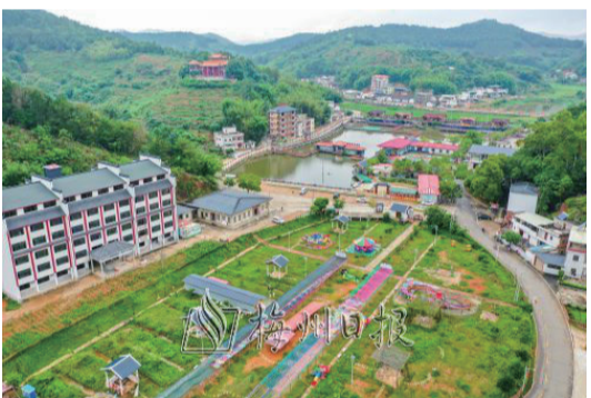
徑南鎮新洲村作為示範帶建設的先行點，示範點，如今已迎來美麗蝶變。

這個示範帶涉及徑南鎮共10個村，總面積51.5平方公里，涉及人口1.5萬人。項目計劃共投入資金2億元，推動沿線交通公路改造提升、中小河流治理、農房風貌管控、文化