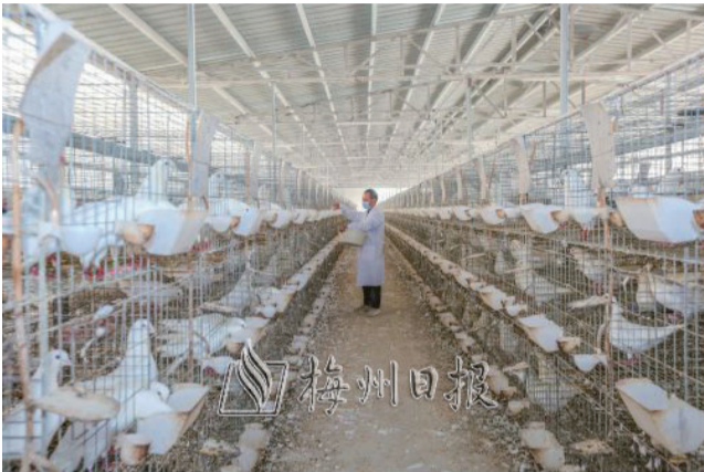
肉鵝養殖基地帶動農戶發展規模化養殖。

近年來，興寧市以產業、人才、文化、生態、組織“五大振興”為抓手，奮力在全面推進鄉村振興上展現新作為，農業高質高效、鄉村宜居宜業、農民富裕富足的振興藍圖初步呈現，奏響了一曲鄉村振興的時代強音。