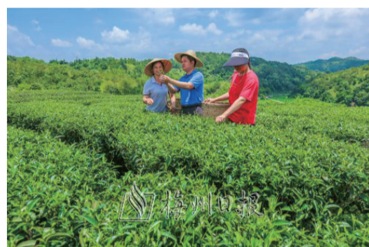
徑南鎮大力推廣茶園生態化種植，深入實施品牌戰略，加快產業升級。

範帶內種植出產的農特產品質量上乘。徑南鎮圍繞培育果、茶、酒、康養文旅四個主導產業，推動產業融合發展。其中茶葉種植有2.1萬畝，通過大力推廣茶園、果園生態化種植，深入實施品牌戰略，加快產業升級，推動“茶旅結合、以旅興茶”，實現農旅聯動。